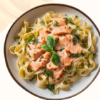
Tagliatelle al Salmone 15€

Tagliatelles nappées d'une sauce crémeuse aux lardons et œufs