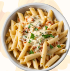
Quattro Formaggi 14€

Pâtes servies avec une sauce bolognaise maison riche en saveurs