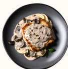
Cremosa al Tartufo 18.5€

Escalope de dinde garnie de jambon de Parme et de mozzarella fondante