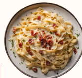
Carbonara Cremosa 14€

Penne al dente avec une sauce fondante aux quatre fromages italiens