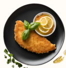
Milanese Classica 15€

Escalope de dinde panée à l'italienne, croustillante et dorée