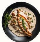
Tacchino al Gorgonzola 17€

Escalope de dinde nappée d'une sauce crémeuse au champignon et parfumée au truffe