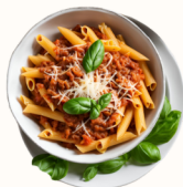
Bologna Tradizionale 12€

Pâtes servies avec une sauce bolognaise maison riche en saveurs